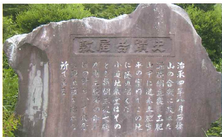
青年会が設置した小道地蔵寺屋敷跡の碑