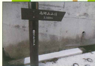
歩いていると、こんな案内板が