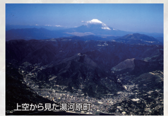
上空から見た湯河原町

しながら、どこか一つでも突破口を見出し、いく、ということに改めて感じました。湯河原温泉はやはり、宿泊・観光が基幹産業だと中心的な事業なんだということをご理解をいただきたいと思えます。