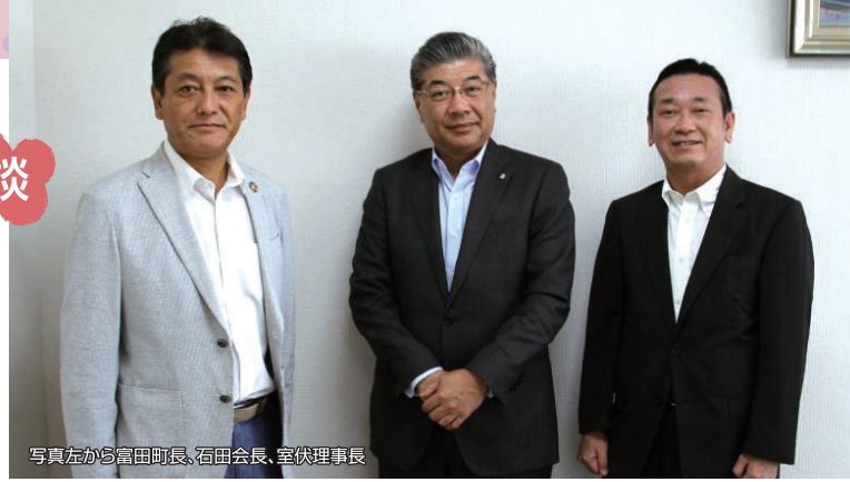
写真左から富田町長、石田会長、室伏理事長 湯河原温泉旅館協同組合 理事長 湯河原温泉観光協会 会長 湯河原町長